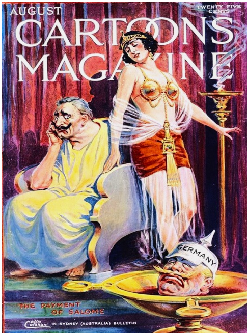
Рис.3. «Плата Саломеї».