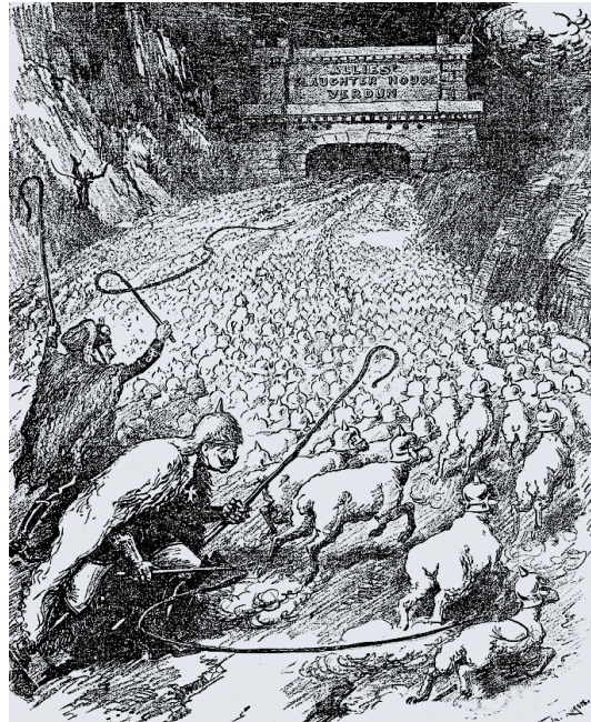
Рис.4. «На забій як овець».