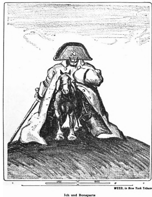
Рис. 1. «Євангеліє від святого Вільяма». Рис.2. «Я і Бонапарт».